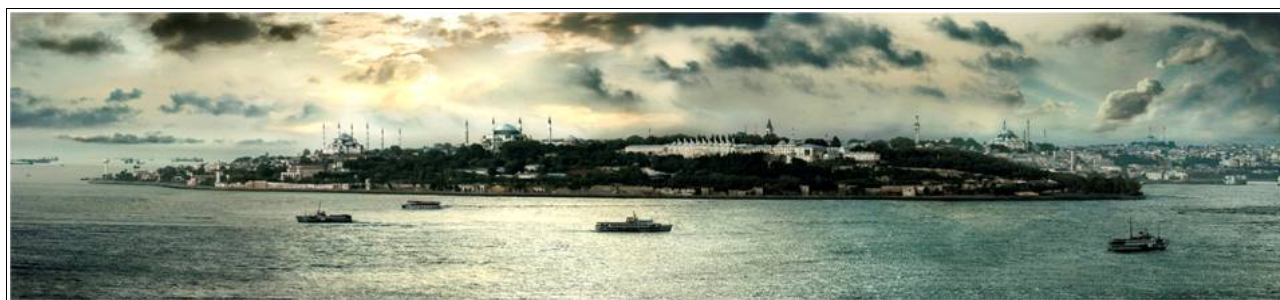
Istanbul depuis le Bosphore