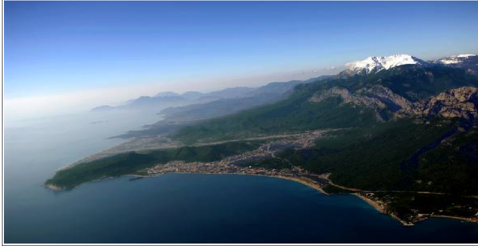
Le Mont Olympe dominant le littoral lycien