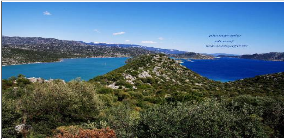
Baie de Kekova