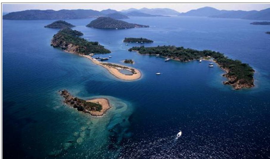
les 12 îles, baie de Göcek, Fethiye