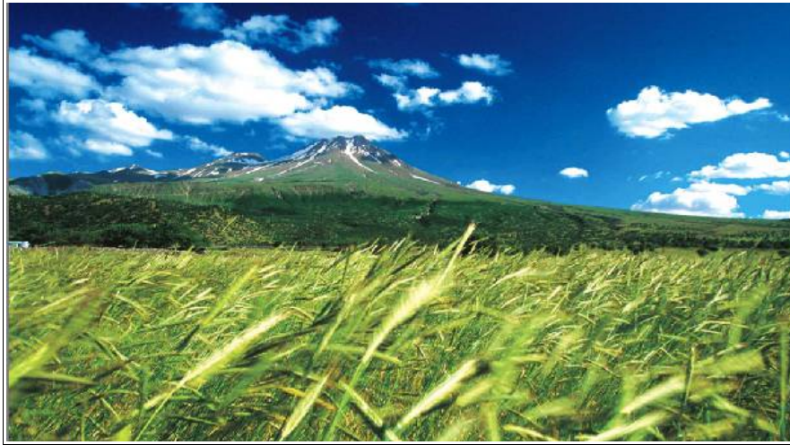
Volcan Hasan, vallée d'Ihlara, Cappadoce